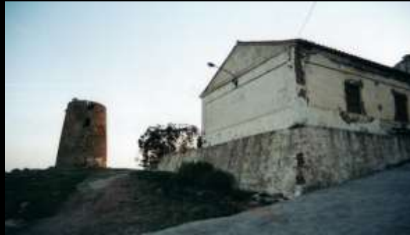
antiguo cuartel y torre de punta paloma: dos espacios de oportunidad olvidados.

La población ha ido encontrando acomodo en algunos solares vacíos como respuesta a sus necesidades. Al norte, lindando prácticamente con la carretera, se sitúan unas pistas deportivas que, si bien son deficitarias, al menos son utilizadas frecuentemente. Otra carencia, reclamada por sus habitantes, es un equipamiento religioso.