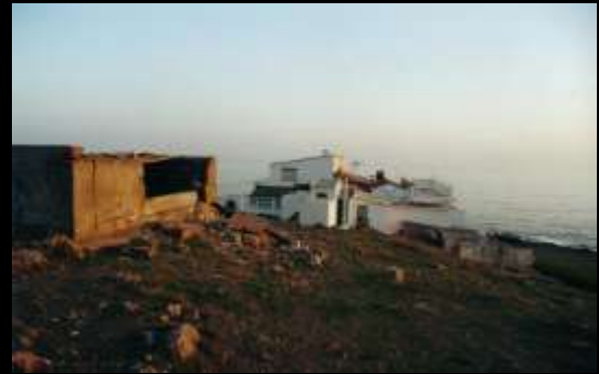
vista general del núcleo residencial

La zona ofrece un grado de ocupación alto, condicionada por las características económicas de su población. Algunas edificaciones presentan un estado de degradación acentuado.